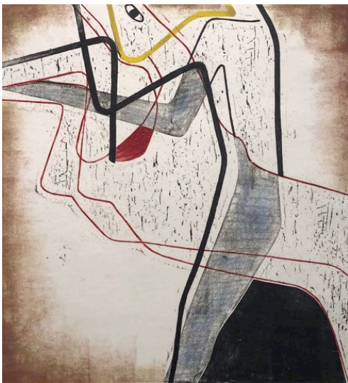
Johanna Schütz-Wolff, Mann und Pferd, 1957, Farbholzschnitt, 58,9 x 54,1 cm