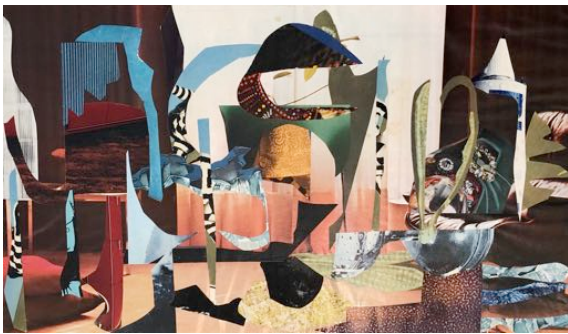
Dorothea Behrens, o.T., 1973, Collage, 30 x 51 cm