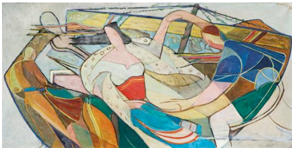
Else Hertzner, Mazurka (Tanz um den Maibaum), 1953/1954, Öl, 75 x 150 cm